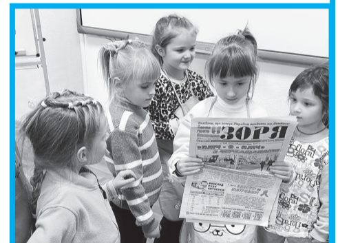
Наші читачі у різних куточках України

25 травня – День журналіста України, котрий був встановлений згідно з Указом Президента країни у 1994 р.