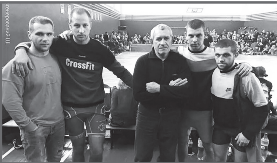
На знімках: майстер (у центрі) зі своїми учнями.