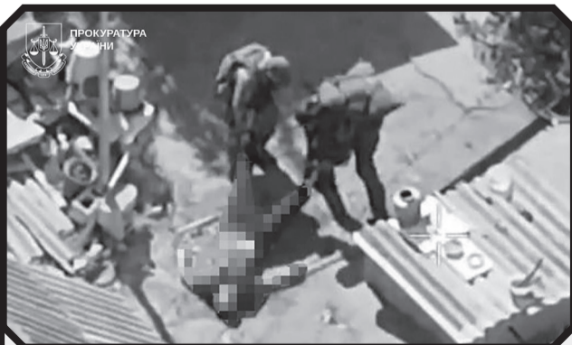
На знімку: Російські військові стоять над тілом вбитого цивільного.

Виконуючи цей наказ, військові рф убили щонайменше одного місцевого жителя. Згодом, намагаючись приховати злочин, тіло загиблого сховали на території приватного домоволодіння.