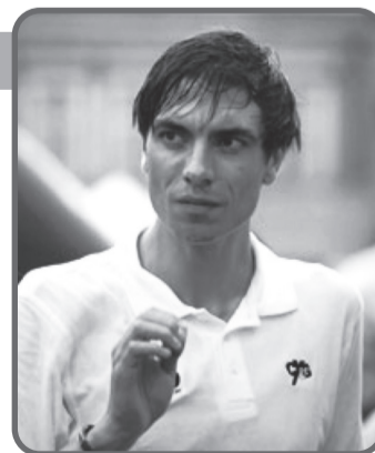
став світовою спортивною зіркою.