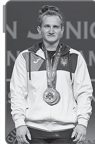
Каміла Сергіївна КОНОТОП (нар. 23 березня 2001, м. Лиман, Україна) — українська важкоатлетка, Майстер спорту України міжнародного класу, чемпіонка Європи 2021 року.

Зараз проживає в Одесі і тренує збірну у Києві.