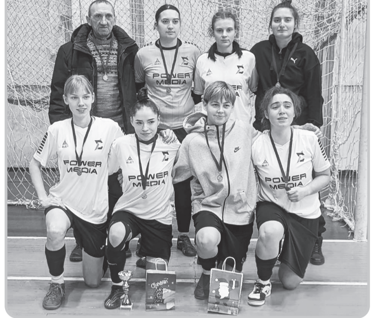
На знімках: учасниці турніру «Фурія СІР»; нагородження гравчинь кращих у номінаціях; головний тренер Національної збірної команди України з жіночого футболу Олександр Золотухін проводить нагородження.

У столиці нашої Незламної України напередодні Різдвяних і Новорічних свят відбувся турнір з жіночого футболу, у котрому взяли участь п'ять команд вищої ліги, а саме: КНУБА (Київський Національний університет будівництва та архітектури), КНУ ім. Т. Г. Шевченка (Київський Національний університет), ЖФК «Енергія» - «Багіра» - ДЮСШ-2 (друга команда) (м. Київ + м. Лиман, Донецька область), СК «Фурія» (м. Київ), ДЮСШ м. Коцюбинське (Київська область).