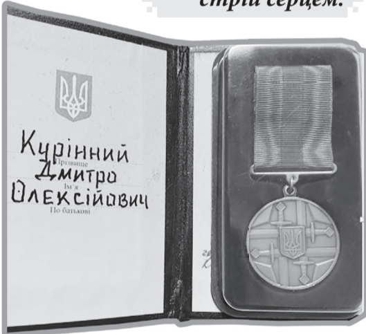
Дмитро Курінний – зв'язківець, який служить на передовій із 2017 року. За свою службу Дмитро також був відзначений – він має нагороду, фото яку також надала Тетяна.