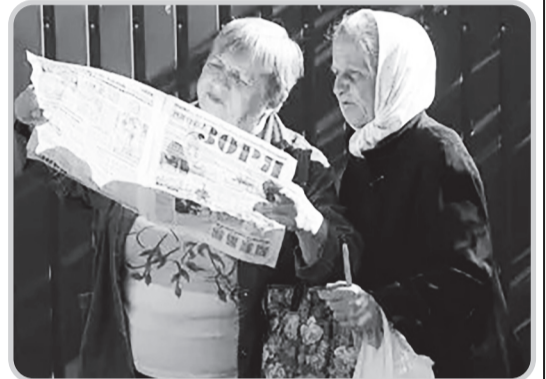
НА ЗНІМКАХ: На сходах громадян

Ми триматимемо вирішення цього питання на контролі і повідомимо жителів громади про його виконання на шпальтах місцевого часопису. "ЗОРЯ" і надалі докладатиме зусилля на виявлення першочергових проблем жителів громади та пошуку їх вирішень.