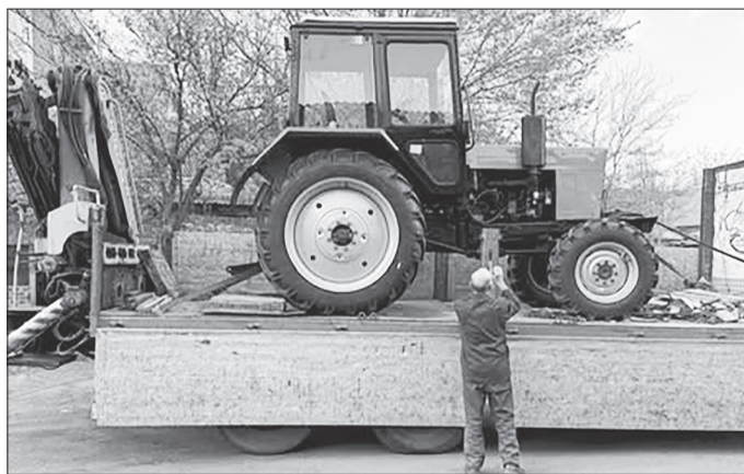
Пресслужба ДП «Лиманський лісгосп»