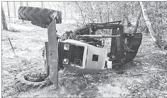
На знімках: Трактор лесхоз: ДО та ПІСЛЯ РЕМОНТУ

Мінералізовані смуги — це протипожежні бар'єри, створені механізованим способом шляхом оранки ґрунту. На таких ділянках видаляються всі наземні горючі матеріали, щоб запобігти поширенню низових пожеж. Водночас в умовах постійних ворожих обстрілів лісових масивів, навіть подібні профілактичні заходи не завжди є ефективними.