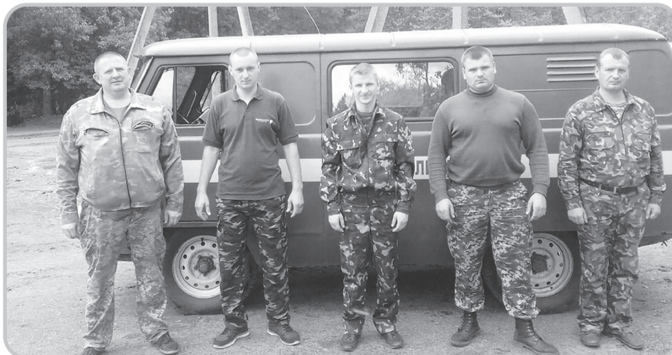
Олексій з колегами-лісівниками