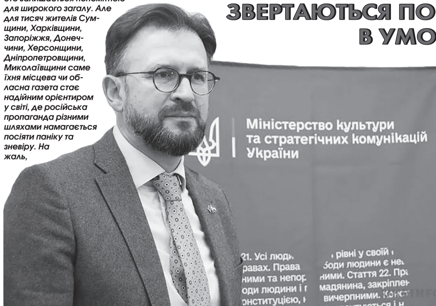
Заступник міністра культури та стратегічних комунікацій Андрій Наджос

Нещодавно Національна спілка журналістів збрала понад 80 редакторів та журналістів з усієї України на зустріч із керівництвом Міністерства культури та стратегічних комунікацій. Причина зустрічі — обговорити шляхи виживання місцевих видань в умовах, коли реклама зникла, кількість передплатників зменшується, а міжнародну допомогу, на яку багато хто покладався, призупинено. Чи зуміє держава врятувати місцеві газети і чи зможуть люди, особливо на прифронтових територіях, і далі отримувати свої улюблені видання?