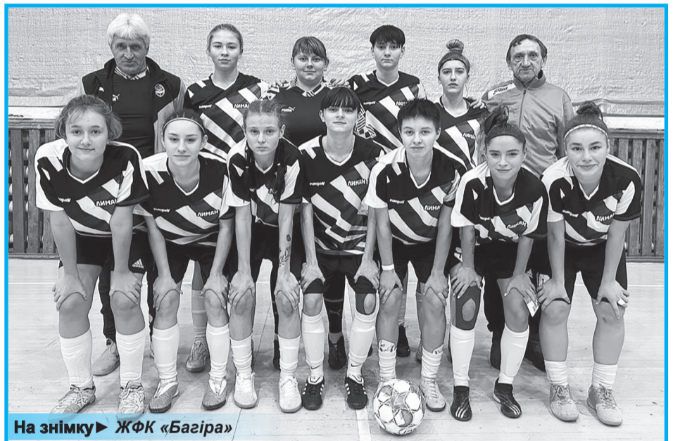
На знімку ▶ ЖФК «Багіра»

Напередодні Різдва Христового у Києві відбулися 5–6 тури чемпіонату України серед жіночих футзальних команд Вищої ліги країни.