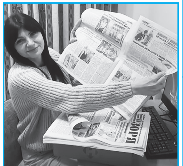
На знімку: «Зоря» отримали на Закарпатті.

Журналісти «ЗОРІ» цілий рік працювали у форматі – на випередження. Ми розуміли, що два номери друкованої «ЗОРЬКИ» замало, але ми її доповнювали соцмережійною інформацією у «Зорі інфо».