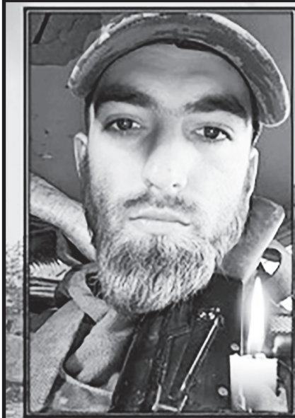
ВІЧНА ПАМ'ЯТЬ ГЕРОЮ!