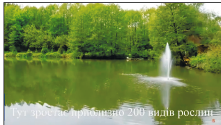
Тут зростає приблизно 200 видів рослин

Ім байдуже було, що на території «Лісового намиста» знаходилось понад 200 видів дерев і чагарників з усього світу, а скільки білих та чорних лебедів, кенгуру, альпаків, диких кабанів, оленів, поні, єнотів та єнотовидних собак.