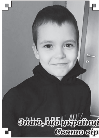
Знає, що українці - нація сильних духом! Свято вірю у ПЕРЕМОГУ! Слава УКРАЇНІ!