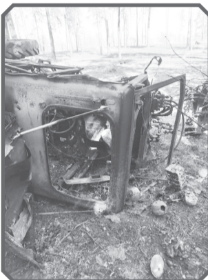
«На знімках: лісова пожежа і підірваний трактор».

майже всі ділянки лісу потенційно смертельними. Нерозірвані снаряди, міни та інші вибухонебезпечні предмети створюють постійну загрозу для життя працівників, які попри безпеку продовжують виконувати свої обов'язки.