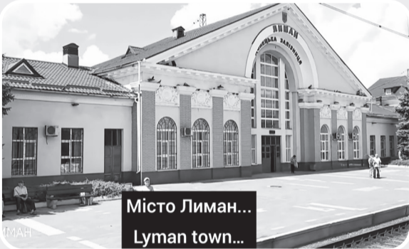
Місто Лиман... Lymanshchyna town...