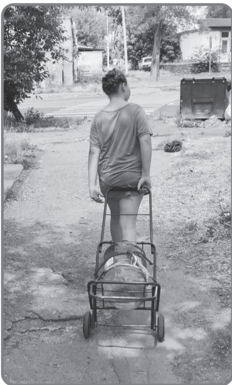
У суворому Миколаєві дітей змалку привчають долати життєві перепони: вони возять воду.

Мільйони українців щодня стикаються з проблемою доступу до чистої питної води. Від Миколаєва, де вода з-під крана солонна, до окупованих територій, де люди ризикують життям у пошуках води, - війна загострила давні проблеми водопостачання та створила нові. Як змінилася ситуація з водою в різних регіонах України і які рішення пропонують влада та міжнародні партнери?