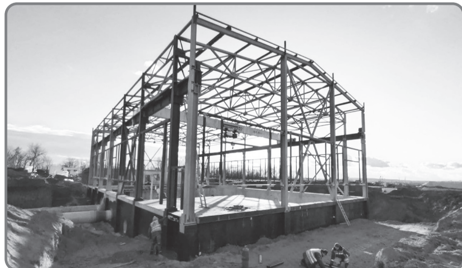
Гілка нового водогону на початку року дійшла до Апостолового і почала постачати воду в це місто.

Назарій Віварчик, для інформаційної служби НСЖУ