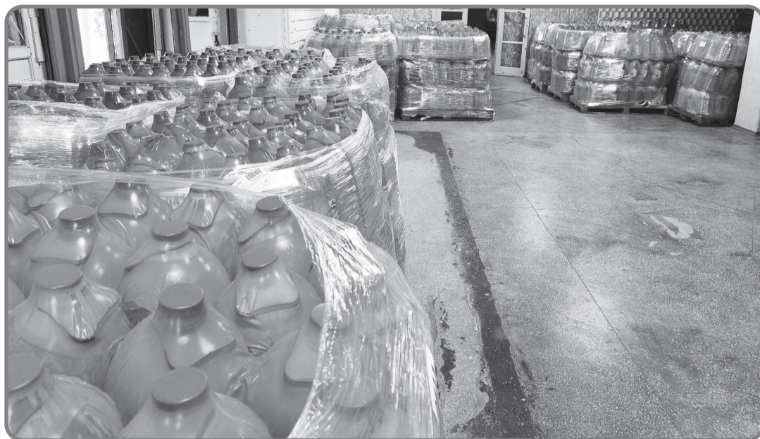
Жителі Новovorонцовки отримали питну воду від міжнародних благодійників.

З підривом Каховської ГЕС загострилася проблема з питною водою на Запоріжжі та Дніпропетровщині.