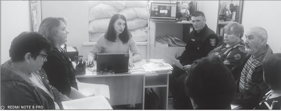
Відбулося засідання Координаційного центру підтримки цивільного населення при Лиманській міській раді.

Нагальними питаннями було надання допомоги місцевому населенню та внутрішньо переміщеним