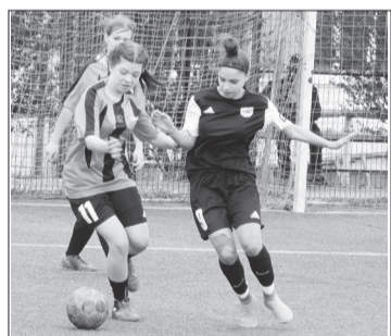
На знімку: ігровий момент і «Багіра».

За коловою системою в одне коло команди розіграли місця у групах. Після чого команди, які посіли третє місце зіграли за 5-6 сходинок турнірної таблиці: ФК «Синельникове» - ФК «Олександрівка» - 3:0. А у півфіналах зустрілись: ЖФК «Металіст 1925» «Шахтар» (Білетьке) - 3:0, «Шахтар» (Добропілля) - «Багіра» (Лиман) - 3:2. «Пантерочки» по ходу матчу вели у рахунку 2:0, але перевагу не змогли утримати. Однак за третю сходинку впевнено перемогли білетький «Шахтар» - 2:0. У фіналі добропілляський «Шахтар» переміг харківський «Металіст 1925».