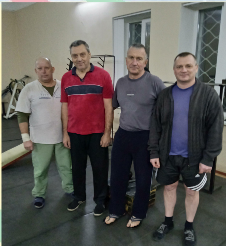
На знімку: група атлетів – ветеранів ФСК «Локомотив».

У їх сильній команді і працівник будівельної групи локомотивного депо